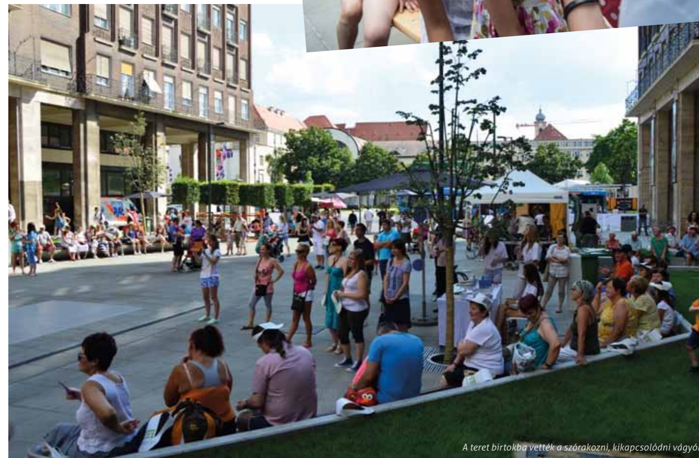
A teret birtokba vették a szórakozni, kapcsolódni vágyók