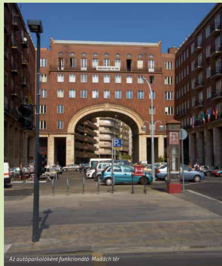
Az autóparkolóként funkcionáló Madách tér

„Az épület alkalmas lesz kisebb koncertek, konferenciák, kiállítások, színházi előadások és más rendezvények megtartására.”