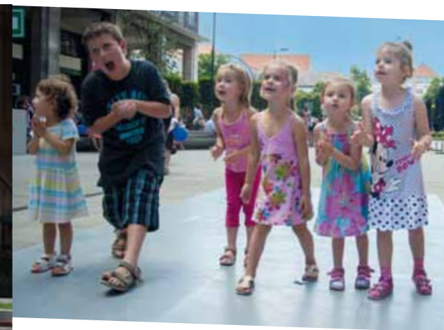
A programokon kisebbek és nagyobbak egyaránt jól érezték magukat A gyermekek körében igen népszerű volt az arcfestés