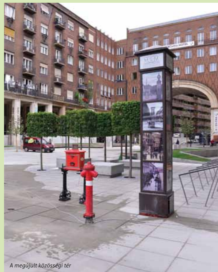
A megújult közösségi tér