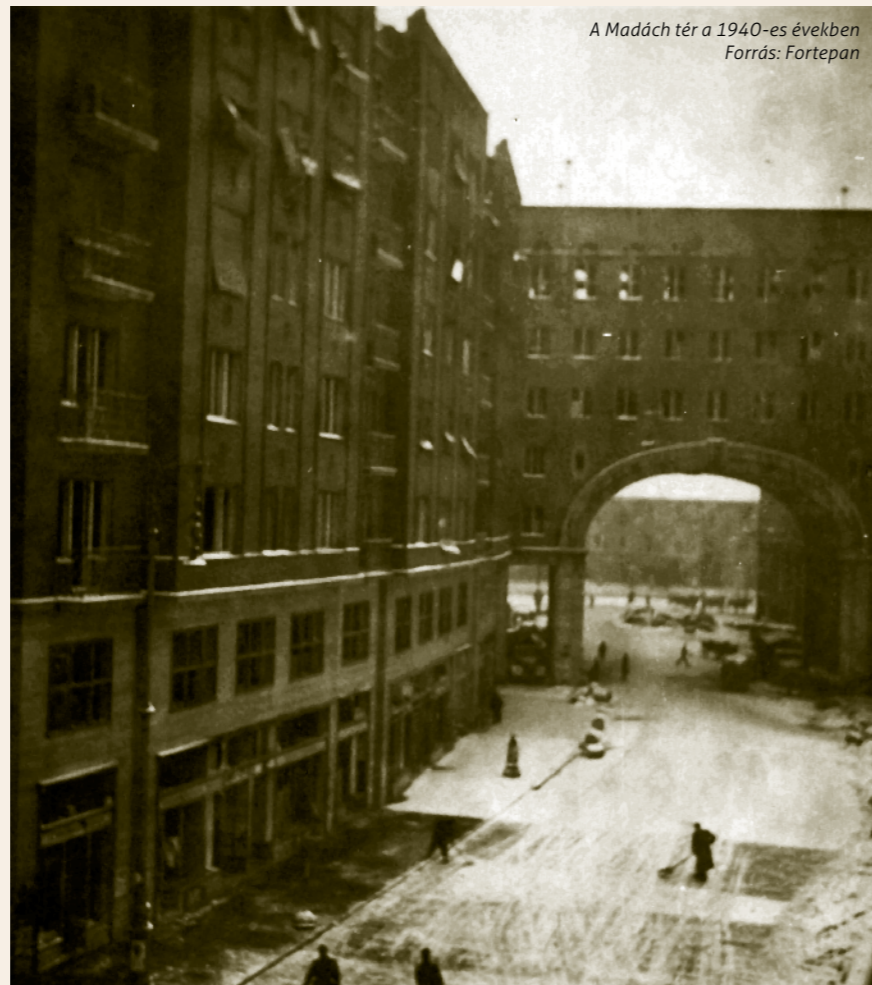
A Madách tér a 1940-es években